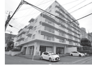
ナビ検索 中央区水前寺3-5-20